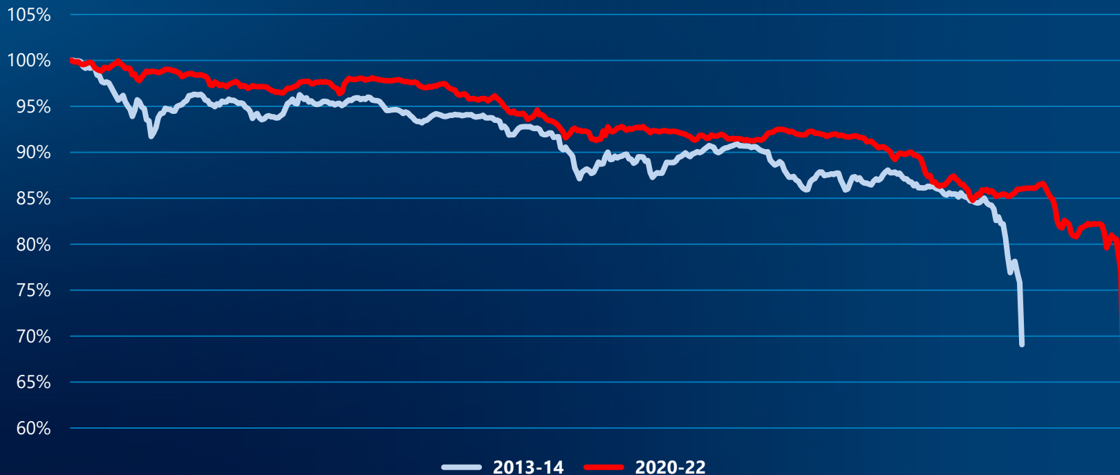
Динамика индекса RGBI* от глобальных пиков